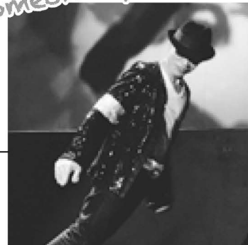
A Tribute to Someone Special MJ

マイケル・ジャクソンのヒット曲をメドレーでお届けします。EBIKENならではの驚愕&爆笑の演出は必見です。