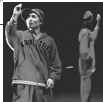
Another side of Me

鏡の中のもう1人のEBIKENと展開されるダンス&イリュージョン。不思議な世界に、会場のお客様は釘付けとなります。